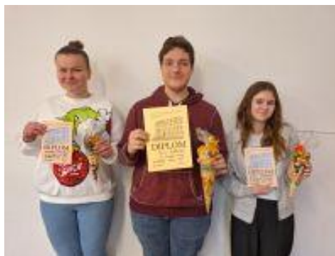
Vítězové II. kategorie